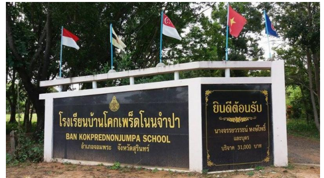
ภาพที่ 1 โรงเรียนบ้านโคกเพ็ดโนนจำปา

ก่อนประถมศึกษา จำนวน 1 ตู้ เครื่องพิมพ์ จำนวน 1 เครื่อง คอมพิวเตอร์พกพา (Tablet)(ใช้บริหารจัดการ) จำนวน 1 เครื่อง เครื่อง เครื่องคอมพิวเตอร์พกพา (Notebook)(ใช้บริหารจัดการ) จำนวน 1 เครื่อง โต๊ะเก้าอี้