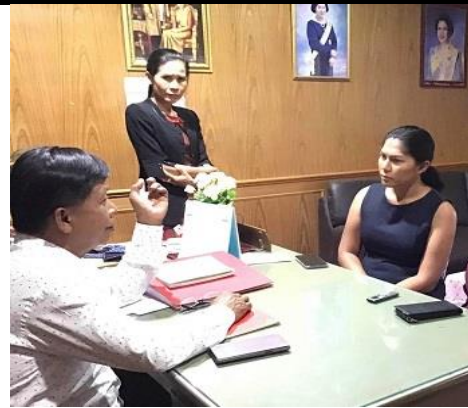
ภาพที่ 3 สัมภาษณ์ผู้บริหารโรงเรียนบ้านจอมพระ

ควรรวมมาอยู่ในความดูแลของโรงเรียนขนาดใหญ่และขนาดกลางที่มีศักยภาพ เมื่อมีการบริหารจัดการด้านการเรียนการสอนที่ดีมีคุณภาพ ส่งผลให้นักเรียนโรงเรียนควรรวมมีผลการเรียนดีขึ้น มีการพัฒนาการด้านการอ่าน เขียน คิดวิเคราะห์ที่ดีขึ้น ได้รับการพัฒนาด้านคุณลักษณะที่พึงประสงค์ และเข้าร่วมกิจกรรมเสริมการเรียนรู้เช่นทัศนศึกษาในพื้นที่ ด้านการบริหารโรงเรียนควรรวม โรงเรียนที่รับโอน ได้ดำเนินงานการบริหารโรงเรียนควรรวมตามนโยบาย “โรงเรียนดีใกล้บ้าน” ตามคู่มือที่ได้รับส่วนการบริหารงบประมาณ พบว่า มีงบประมาณเพิ่มขึ้นตามจำนวนเด็กที่ย้ายมา ส่วน วัสดุ ครุภัณฑ์ต่างๆ อุปกรณ์ สื่อการเรียน อาคารต่างๆ ของโรงเรียนควรรวมถูกถ่ายโอนมายังโรงเรียนรับโอน และมีข้อกำหนดด้านการจัดบริการรับส่งแก่นักเรียนโรงเรียนควรรวมเช่นกัน ผู้บริหารจะจัดการะงานสอนให้แก่ครูโรงเรียนควรรวมอย่างเป็นธรรมและมีความเหมาะสมตามวุฒิการศึกษาและความเชี่ยวชาญ นักเรียนได้รับการบริการ ด้านการศึกษา เทียบเท่ากับนักเรียนในโรงเรียนที่รับการโอนย้าย และมีนโยบายการช่วยเหลือค่าใช้จ่ายในการศึกษาสำหรับนักเรียนยากไร้ ในโรงเรียนควรรวมด้วย ส่วนรายงานผลที่ ต้องเสนอต่อสำนักงานเขตพื้นที่การศึกษา นั้นแยกจัดกันในปี 2559-2561 ซึ่งเกิดปัญหายุ่งยาก ซ้ำซ้อน และต่อมาในปี 2562 ได้มีการควรรวมโรงเรียนสมบูรณ์จึงไม่จำเป็นต้องแยกรายงานต่อไป การบริหารจัดการจึงคล่องตัวและดีขึ้นตามลำดับ