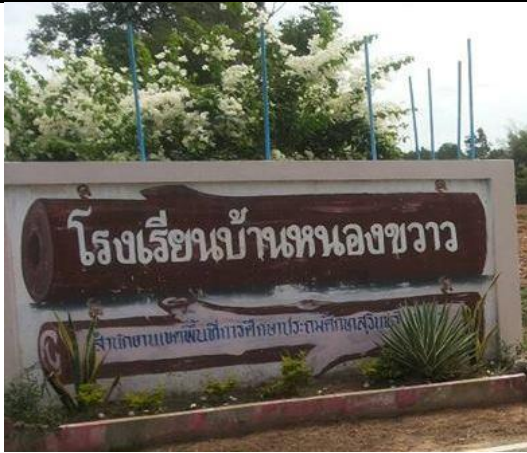
ภาพที่ 2 โรงเรียนบ้านหนองขาว