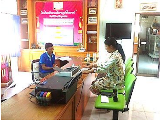
ภาพที่ 4 สัมภาษณ์ครูโรงเรียนบ้านขามเต็อรราชภฏ์สงเคราะห์

การเยี่ยมบ้าน ภาคเรียนละ 1 ครั้ง เพื่อสร้างความสัมพันธ์ที่ดีกับผู้ปกครอง ชุมชนและทำให้นักเรียนเกิดความรู้สึกดีหรือรักในการเรียน ส่วนโรงเรียนขนาดกลางใช้วิธีการให้พี่ช่วยน้อง เพื่อนช่วยเพื่อน ทำให้นักเรียนในโรงเรียนรู้จักกันและสามารถเรียนและทำงานร่วมกันได้ รวมทั้งกิจกรรมครูเยี่ยมบ้านด้วยเช่นกัน