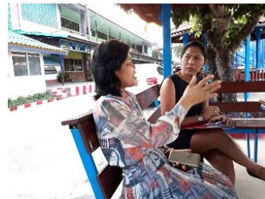
ภาพที่ 5 สัมภาษณ์ครูโรงเรียนควบรวม

ร่วมสร้างมา และไม่เข้าใจเหตุผลในการควบรวม เมื่อย้ายโรงเรียนผู้ปกครองต้องให้ค่าขนมกับนักเรียนเพิ่มจาก 10 บาท กลายเป็น 40 บาท ส่งผลกระทบต่อเศรษฐกิจในครอบครัว ที่ต้องหาเงินให้ลูกเพิ่มขึ้น ชุมชนที่นักเรียนไปเรียนโรงเรียนบ้านจอมพระต้องรับประทานอาหารรับส่งนักเรียนเองเพราะทางโรงเรียนไม่สามารถจัดทำให้ได้ เด็กสังคมเมืองชอบเล่นโทรศัพท์เมื่อย้ายไปทำให้เด็กอยากได้โทรศัพท์ราคาแพงไปด้วย แต่ผู้ปกครองบางคนเห็นพ้อใจ เนื่องจากเชื่อว่าการส่งลูกเรียนในโรงเรียนที่มีความพร้อมทางการศึกษาเด็กจะได้รับโอกาสทางการศึกษาที่ดีกว่า มีความรู้มากกว่าเดิม มีการพัฒนาทางการเรียนได้ดีกว่าเดิม ด้านนักเรียน พบว่าในช่วงแรกนักเรียนกังวล เมื่อปรับตัวได้นักเรียนสามารถเรียนร่วมกับเพื่อนได้ดี นักเรียนส่วนใหญ่มีความพึงพอใจเพราะมีอุปกรณ์การเรียนการสอนพร้อม มีกิจกรรมให้เล่นมากมาย